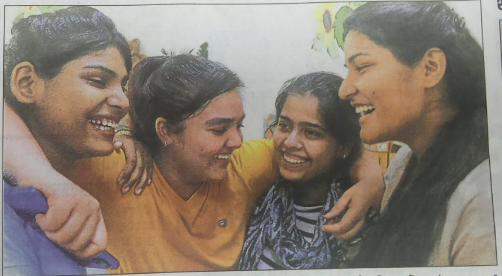
सीबीएसई 12वीं के शुक्रवार को परिणाम आने के बाद सेक्टर 73 स्थित यदु पब्लिक स्कूल में खुशी जाहिर करती छात्राएं।