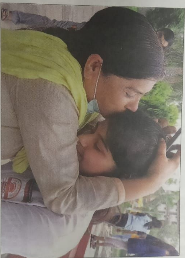
सेक्टर-73 स्थित स्कूल में पास होने वाली अपनी बेटी को गले लगाती मां।

जिले में कभी भी 100 प्रतिशत रिजल्ट नहीं रहा है। इसके करीब पहुंचने पर अधिकांश छात्रों के चेहरे खिलने लगे। वहीं, इस बार 15847 छात्र-छात्राओं ने सफलता प्राप्त की है। इनमें 6655 छात्राएं और 9192 छात्र शामिल हैं। जिले में सीबीएसई बोर्ड के अंतर्गत 148 इंटरमीडिएट के स्कूल संचालित हो रहे हैं। सीबीएसई बोर्ड के क्षेत्रीय अधिकारी पीयूष शर्मा ने बताया कि कोरोना संक्रमण के कारण परीक्षा का आयोजन नहीं किया गया था। परिणाम में रिकार्ड बच्चे सफल रहे हैं। नए पैटर्न पर आधारित जिले का यह रिजल्ट छात्रों के लिए बेहतर परिणाम लेकर आया है।