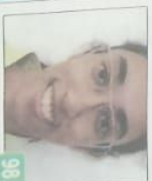
सुशोनी कुमार प्रज्ञान स्कूल, ग्रेटर नोएडा