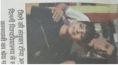
जिले की संयुक्त टॉप पर अमर उजाला दिल्ली विश्वविद्यालय से रजिस्ट्रार का श्रेय म

भविष्य में क्या बनना है। इससे लेकर फिलहाल ज्यादा चिंता नहीं है। अभी रिजल्ट विश्वविद्यालय नेटऑफ का नैसा कि आगे 12वीं की परीक्षा में सफलता भी का