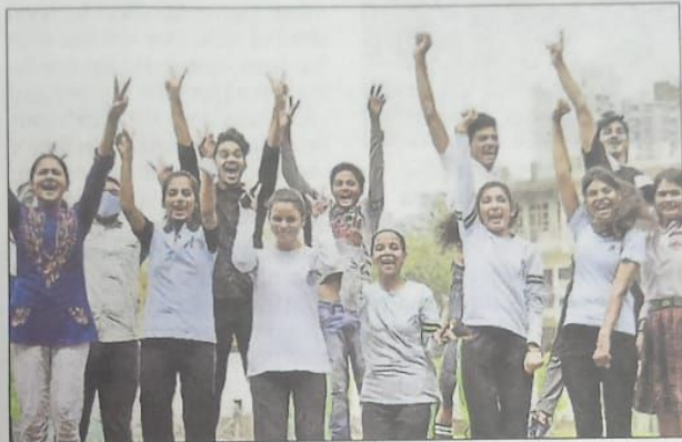
Students celebrate at Yadu Public School at Sector 73 in Noida on Friday after the results came.

"As a special case, the Board will neither declare subject wise merit list of students and nor issue merit certificates to the