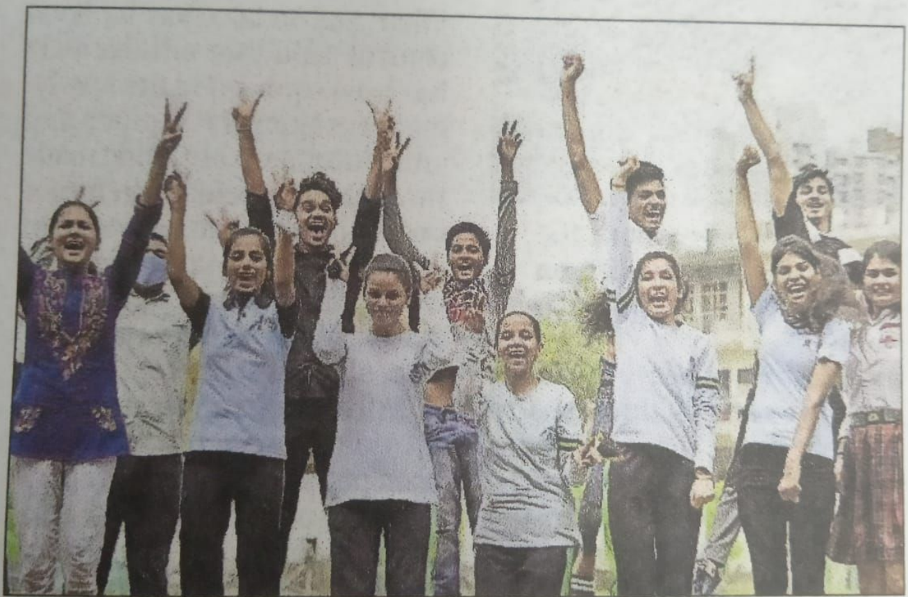
Students celebrate at Yadu Public School at Sector 73 in Noida on Friday after the results came.